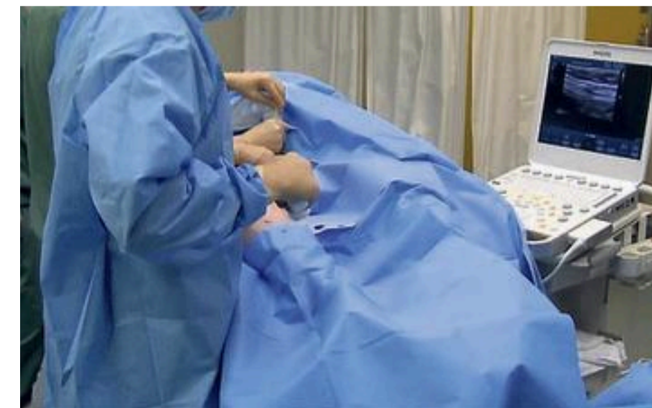
De specialist 'kijkt' in de ader via een scherm.