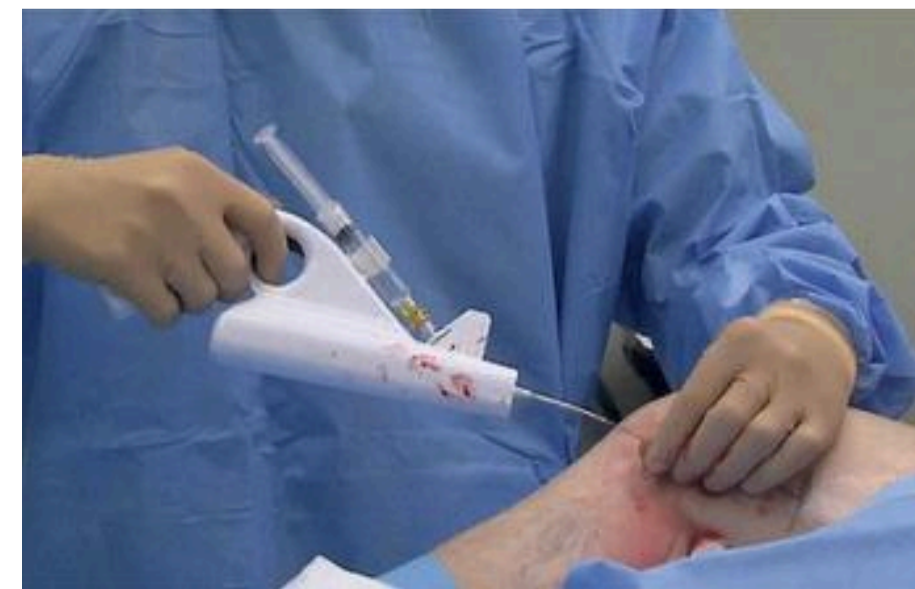
De draad wordt in de spatader gebracht.